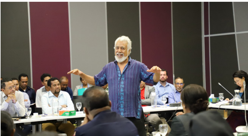
Prezidente KO iha reuniaun ida molok selebrasaun ne'e, Ministériu Finansas, Julu 2019

Selebrasaun ne'e hahú husi 1 Julu to'o 30 Agostu iha munisípiu Timor-Leste nia laran tomak. KO promove dansa no múzika tradisional hodi prezerva Timor-Leste nia kultura no istória nasional no asegura katak sei pasa ba jersaun tuir mai. Selebrasaun ne'e taka ho serimónia oficial iha Tasi Tolu iha 30 Agostu.