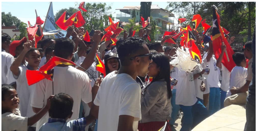
Marsa Dame, Díli, 4 Setembru 2019