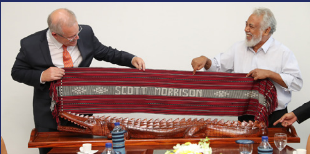
Primeiru-Ministru Austrália nian hasoru malu ho Xefe Negosiador iha Dili, GFM, 30 Agostu 2019

S.E. Xanana Gusmão mos ABC (Australian Broadcasting Corporation) fó sai iha nia notísia, nune'e mos Sir Peter Cosgrove no S.E. Dr. José Ramos-Horta, iha dokumentáriu especial ida, 'A Call to Arms: The Liberation of East Timor'. Favor haré iha ne'e: https://www.youtube.com/watch?v=FhN7zIIXgk4