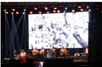
Dili Allstars hananu "Maubere Timor" ho fotografia sira hatudu Timor-Leste