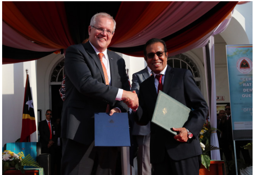
Primeiru-Ministru Scott Morrison ho Primeiru-Ministru Taur Matan Ruak troka nota diplomátika, Palácio do Governo, Díli, 30 Agostu 2019

Bele haré Tratadu ne'e iha ne'e: http://www.gfm.tl/wp-content/uploads/2018/03/Port-Timos-Sea-Maritime-Boundary-Treaty_Portuguese.pdf