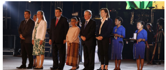
Sira ne'ebé simu Orden Timor