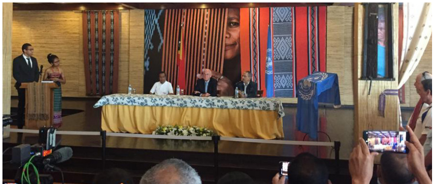
Serimónia lé fila fali rezultadu konsulta popular nian, Hotel Timor, Díli, 4 Setembru 2019

Eventu ne'e tuir fali ho Marsa Dame ida ba Sentru Konvensaun Díli (CCD). Ema atus ba atus mak partisipa, inklui membru governu no parlamentu nasional, konvidadus sira, foinsae sira, estudante sira no komunidade sira.