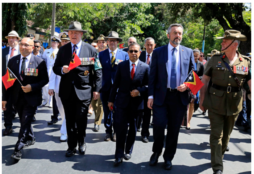
Marsa hodi hanoin fila fali INTERFET, 20 Setembru 2019

Veteranus FALINTIL no INTERFET 250 resin mos participa hotu. Marsa ne'e hodi hanoin fali sakrifísiu tomak Misaun INTERFET nian iha Timor-Leste. Serimónia ne'e taka ho almosu amizade ida ne'ebé S.E. Dr. José Ramos-Horta mak prezide.