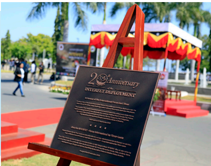
Plaka fó onra ba Forsa INTERFET

Ba dedikasaun no sakrifísiu soldadu no ema sivil sira nian, sira ne'ebé hola parte ba INTERFET, Timor-Leste ofere se plaka ida hodi fó onra ba Forsa ne'e. Prezidente Repúblika no Eis-Komandante INTERFET mos tau aifunan hodi hanoin fali sira ne'ebé mate ona durante luta ba Timor-Leste nia independénsia.