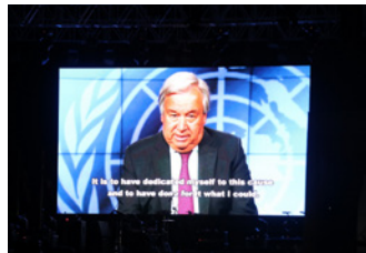
Sek-Jen ONU nia mensajen: "Timor-Leste sai ona inspirasaun ba mundu."