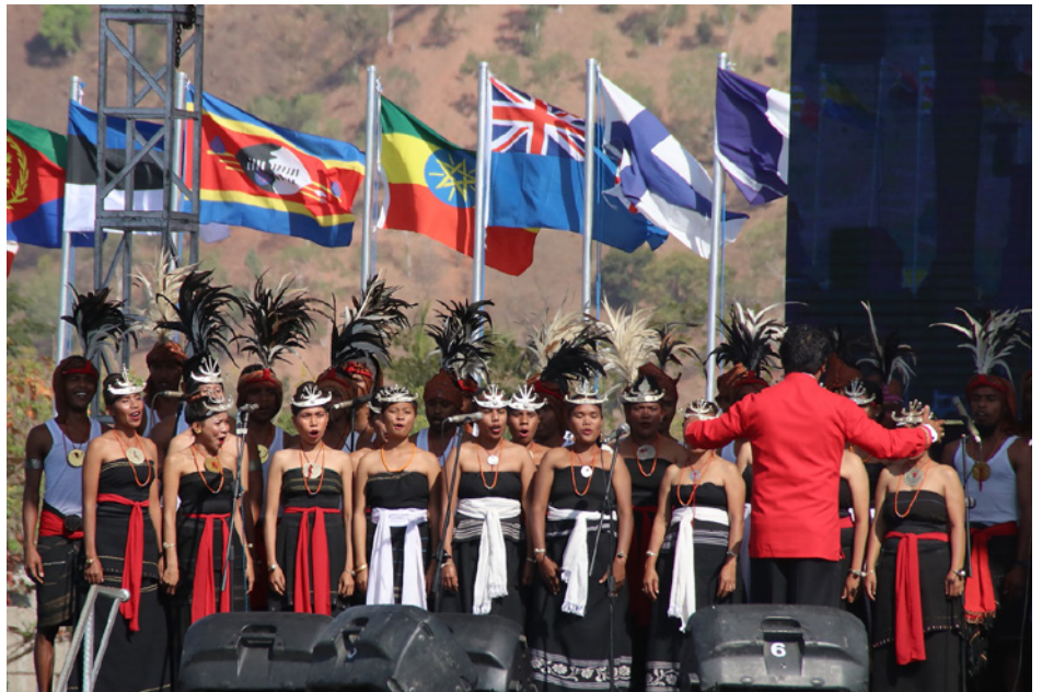
Konsertu molok serimónia ofisial, Tasi Tolu, 30 Agostu 2019