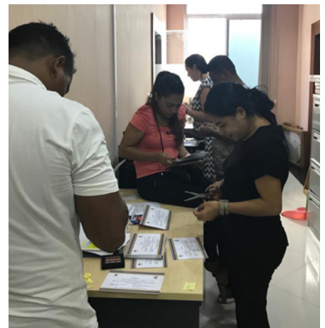
Prepara konvite ba konvidadus sira iha Timor laran, GFM, Agostu 2019