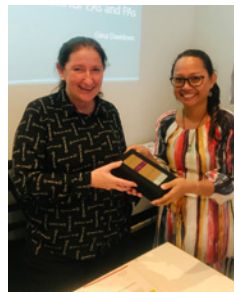
Kompetensia Esensial ba Asistente Ezekutiva, New Horizons, Brisbane, 4-7 Novembru 2019