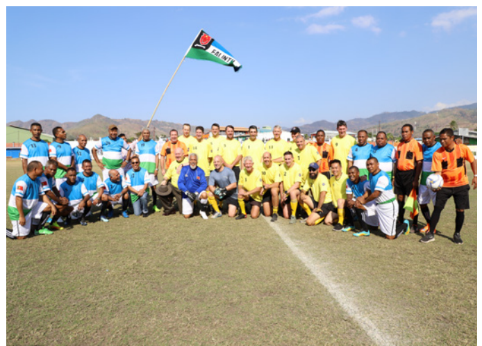
Jogu amizade ida ne'ebé extraordináriu, Estádio Nacional, Dili, 20 Setembru 2019

Konvidadus internasional sira no nai-ulun nasaun nian balu mos, hili oportunidade ida ne'e hodi hasoru S.E. Xanana Gusmão, inklui Primeiru-Ministru Austrália Scott Morrison, Primeiru-Ministru Vanuatu Charlot Salwai, delegasaun ida husi Estados Unidos, nune'e mos Sr. Ian Martin rasik.