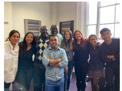
Kursu Intensivu Komunikaun no Relasaun Públika, ISOC, Londres, 4-15 Novembru 2019