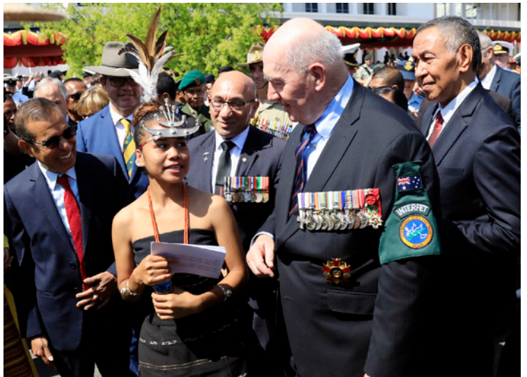
Ania husi Atabae (klaran) hafoin serimónia ne'e, Palácio do Governo, 20 Setembru 2019

S.E. Prezidente Repúblika, no Eis-Komandante INTERFET, Sir Peter Cosgrove mos fó diskursu durante selebrasaun ne'e. Atu envolve mos foinsa'e sira, Ania husi Atabae mos fahé nia esperiensa durante luta ba independénsia no INTERFET.