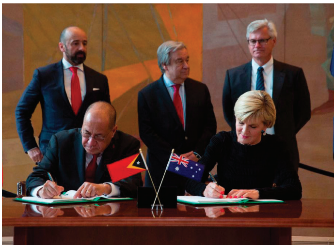
Reprezentante ba Timor-Leste iha Konsiliaun, Ministru Agio Pereira asina Tratadu Fronteira Marítima ho Austrália nia Ministra Negósiu Estranjeiru Julie Bishop iha Sede Nasoens Unidas nian, Nova lorke, iha loron 6 fulan-marsu tinan 2018

Governu Timor-Leste hahú konsiliaun obrigatoria tuir Nasoens Unidas nia Konvensaun ba Lei Tasi nian iha fulan-abril tinan 2016. Hafoin disputa ne'ebé naruk, Timor-Leste hahú prosesu ne'e hodi lori Austrália ba meza negosiasaun nian, atu nune'e nia bele hetan nia direitu soberania no hetan fronteiras marítimas permanente iha Tasi Timor. Hili hakat ida ne'e, TimorLeste sai nasaun dahuluk hodi utiliza mekanizmu ida ne'e tuir Konvensaun.