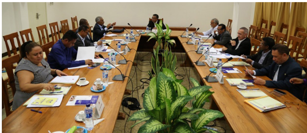
Reuniaun Komisaun Konsultivu Governu Timor-Leste nian kona ba fronteiras marítimas

Maski ho obrigaun sira ne'e, Austrália kaer metin los ba kláuzula 'moratória' ida ne'ebé bazeia ba CMATS no to'o agora lakohi negosia fronteiras marítimas permanentes ho Timor-Leste. Tanba Austrália la rekoñese jurisdisaun kona-ba fronteiras marítimas tribunal internacional nian, mak fronteira marítima permanente ho Austrália só bele deside liu husi negosiasaun bilateral.