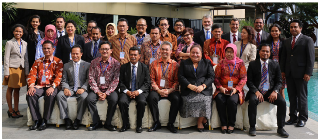
Reuniaun Konsultasaun entre Timor-Leste ho Indonezia

Iha konsultasaun sira ne'ebé halao ona kona ba fronteiras marítimas, Indonezia no Timor-Leste dezenvolve hamutuk Prinsipais Orientadores no Planu Servisu hodi halo negosiasaun. Estadu rua afirma katak pozisaun ba fronteiras marítimas permanente tenki negosia tuir lei internasional, liu-liu UNCLOS. Negosiasaun formal kona ba fronteiras marítimas karik sei hahú iha Marsu 2016.